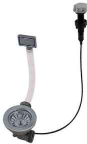
Desagüe automático Gun metal - PG 8407 110