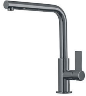
Monomando Omega Gun Metal 8497 856