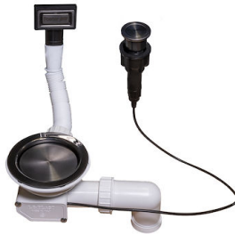
Desagüe automático Space Push Gun Metal - PO 8407 120